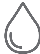
Zużycie paliwa 7,4-7,6 l/100 km